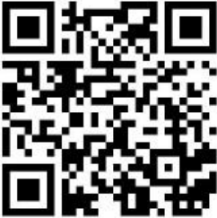
Link zu einem Hologramm-Video